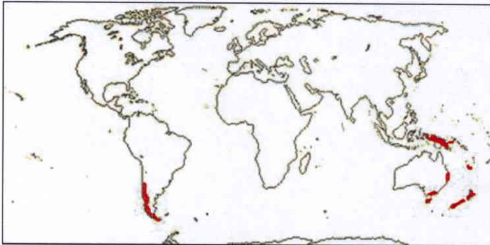
Utbredelseskart for sørbøkfamilien ( Nothofagaceae )

Hvilken rolle spiller fylogenetiske analyser for tolkningen av biogeografiske mønstre?